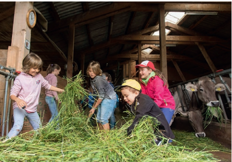
Naturpark Beverin: Wie viel Futter braucht eine Milchkuh?

«Von wo kommen unsere Nahrungsmittel und wie werden sie hergestellt? Wie erreichen sie unseren Teller und was bedeutet das für die Umwelt, Wirtschaft & Gesellschaft?» Erleben Sie das hautnah vor Ort. Im Naturpark Beverin z.B. am Beispiel des Kreislaufes von der Kuh zum Käse, oder vom Getreide zum Brot im Val Müstair!