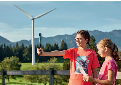
Wissenswertes rund um die Windenergie erfahren die Lernenden auf dem Themenweg Erlebnis Energie Entlebuch