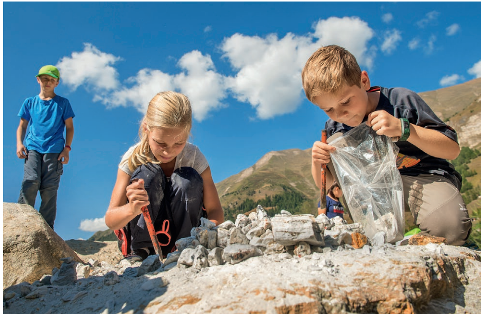
Schüler auf Mineraliensuche vor der Mineraliengrube Lengenbach im Landschaftspark Binnthal