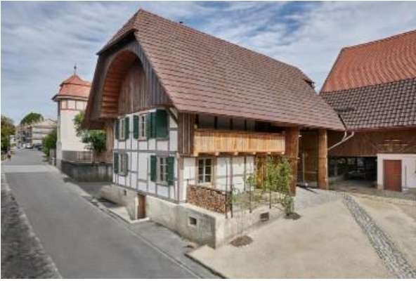
La Taunerhaus à Vinelz (BE) se trouve dans le Parc régional Chasseral.