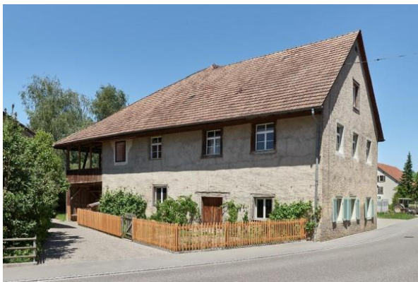
La Flederhaus à Wegenstetten (AG) se trouve dans le Parc du Jura argovien.