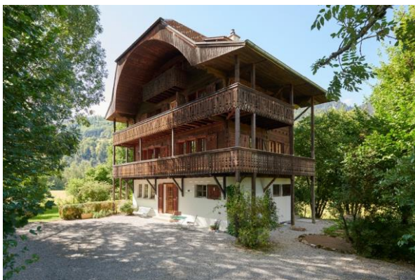
La Maison des Feés à Charmey (FR) se trouve dans le Parc naturel régional Gruyère Pays-d'Enhaut.