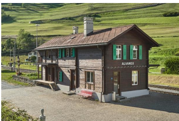
La station RhB Alvaneu à Alvaneu (GR) se trouve dans le Parc Ela.