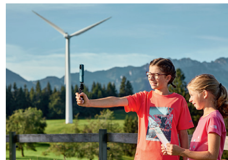
Wissenswertes rund um die Windenergie erfahren die Lernenden auf dem Themenweg Erlebnis Energie Entlebuch